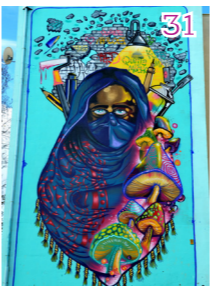
Risca com o que há