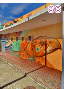
Alegria del Prado