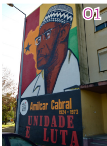
40 anos 40 murais